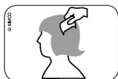
Abb. Durchkämmen des nassen Haars mit Läusekamm vom Haaransatz bis zu den Haarspitzen